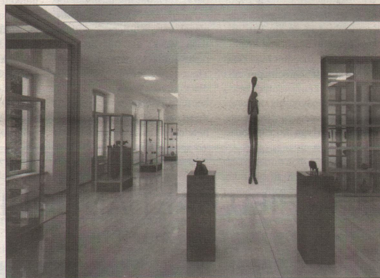
Verzameling Ewald Mataré, Museum Kurhaus Kleve.

van de Rijnlandse beeldhouwer Ewald Mataré, wiens omvangrijke nalatenschap een substantieel onderdeel vormt van de vaste collectie. Zijn sculpturen, waarin hij, uitgaande van de vorm van mens en dier, de grenzen aftaste van vorm en materiaal, komen in de blanke ruimten geheel tot hun recht. Mataré was onder meer leermeester van Joseph