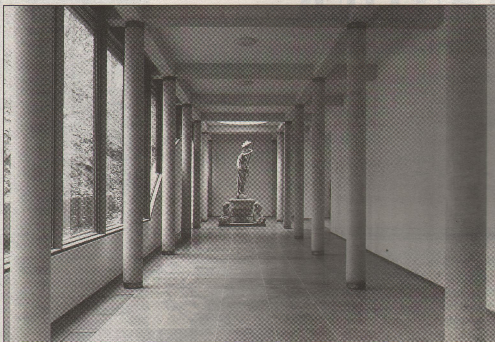
Marmeren beeld van Pallas Athene door Artus Quellinus de Oude, 1660.

In het kortgeleden geopende Museum Kurhaus in Kleef staat op een strategische plaats, tegen de achtergrond van de beboste helling van de Springenberg en belicht via een venster erboven, een marmeren beeld van Pallas Athene, de godin van de wijsheid, wetenschap en kunsten. Zij symboliseert op deze plaats de Kleefse traditie van verzamelen en tentoonstellen die in de zeventiende eeuw een aanvang nam en toont de verbondenheid van het museum met de rijke historie van het gebouw en van de plek waarop het staat.